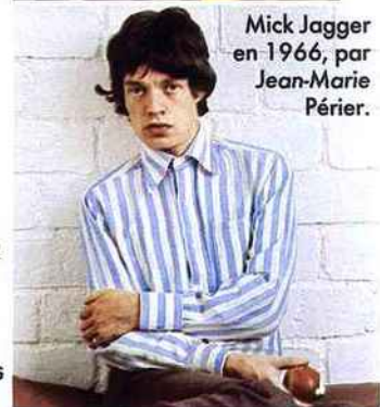
Mick Jagger en 1966